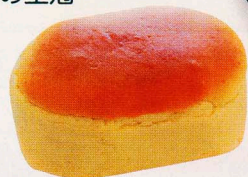
ひとくちチーズケーキメロン味

岡しゅくる・ふるーる 神栖市知手中央3-4-8 ☎0299(96)4884 9:00~19:00 年中無休